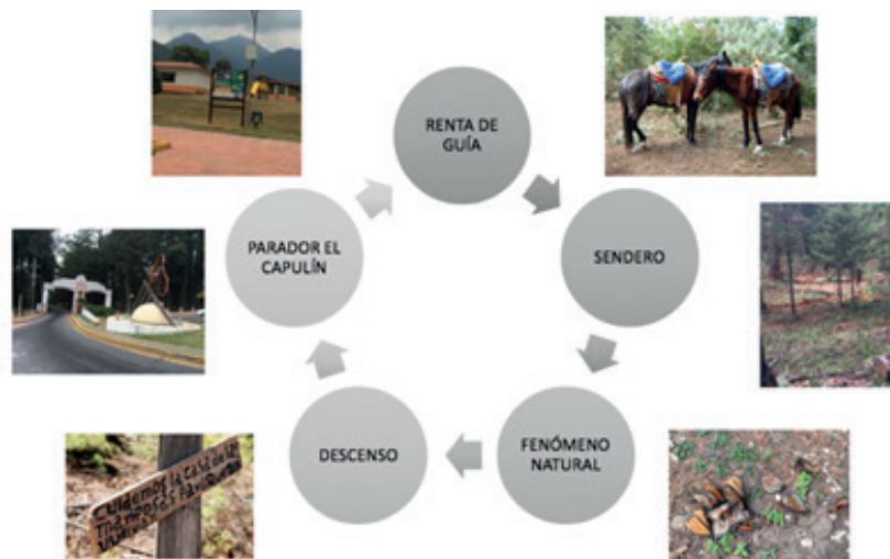
Figura 3. Recorrido turístico en El Capulín, Reserva de la Biosfera Mariposa Monarca, México, 2018

En la zona designada para observar el fenómeno natural, los turistas aprecian a las mariposas en las ramas de los árboles, que, al desprenderse de las ramas vuelan produciendo un zumbido y un espectáculo visual en tonos naranjas y negros. El área de observación se delimita con una barrera de hilo o alambre, no existe tiempo límite para contemplar el fenómeno, pero se recomienda descender la montaña antes de que oscurezca porque los caminos no están en condiciones para transitarlos en la oscuridad y sin guía ( Figura 3 ). Los guías son adultos (40 años) y niños (10 a 15 años) que imparten información empírica sobre el fenómeno, no todos cuentan con certificación y capacitación por parte de la Secretaría de Turismo o la CONANP, pero el trato es cálido con actitud de servicio. La zona para observar la mariposa Monarca es vigilada por los ejidatarios o personas seleccionadas aleatoriamente entre los habitantes de la comunidad para cuidar el comportamiento de los turistas y no dañar a las mariposas o el área natural.